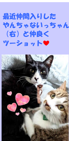
最近仲間入りした やんちゃんいっちゃん(右)と仲良くツーショット♡