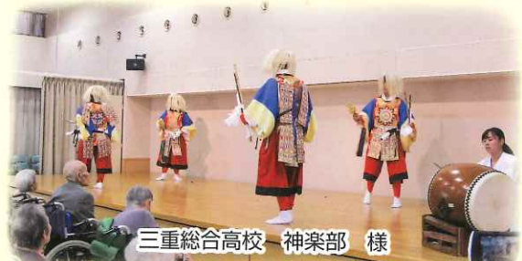
三重総合高校 神楽部 様