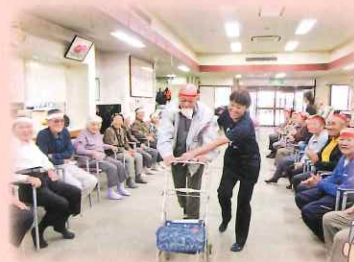
いそいで いそいで こけんように!