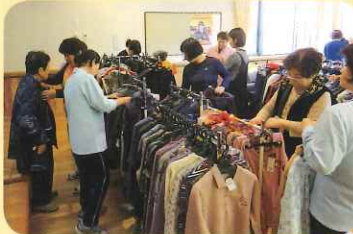
▲「ナガヨシ」訪問販売

入居者皆さんからの意見により、今年度から毎月第一木曜日にトキハやフレインに出かける「買い物バス」をはじめました。大変好評で多くの方が出かける事を楽しみにされています。あまり出かける事が好きでない方は、隔月に緒方町の「ナガヨシ」さんに衣類の訪問販売に来て頂いています。自分の手に取り厚さや肌触りを確認して、色や柄は職員が説明をして選んでもらっております。また、毎週日曜日には、いしかわ商店さんに生活雑貨やお菓子の訪問販売に来て頂いています。