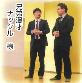
兄弟漫才 ナツクル 様