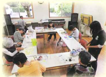
納品に向けて制作を頑張っています♪