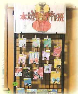
別府のパン屋さんにも商品を置いていただいています。