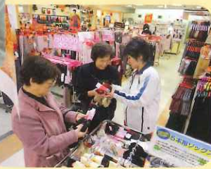
▶買い物バス「トキハ」へ