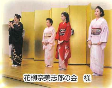
花柳奈美志郎の会 様